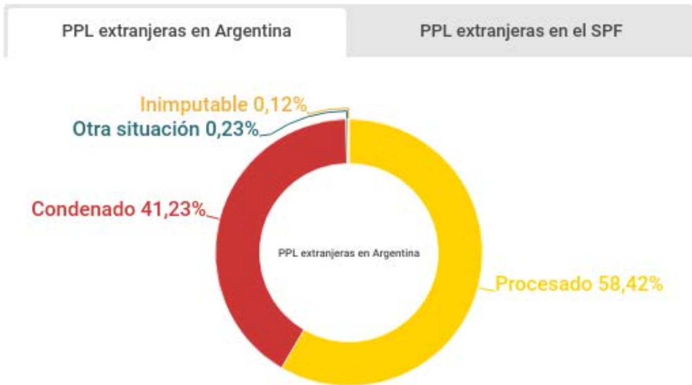
Gráfico: Distribución de PPL extranjeras por situación legal en Argentina y el SPF (2017)