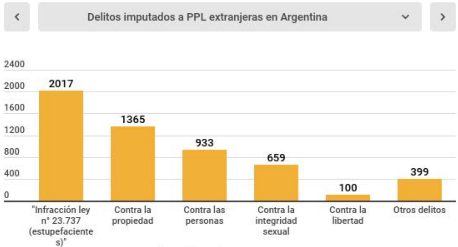
Gráfico: Distribución de delitos imputados a las PPL extranjeras en Argentina y el SPF (2017)