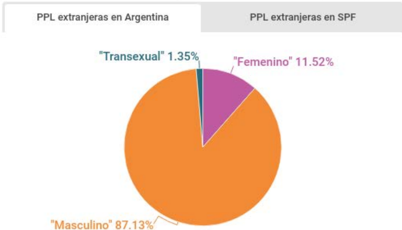
Gráfico: Distribución de PPL extranjeras por género en Argentina y el SPF (2017)