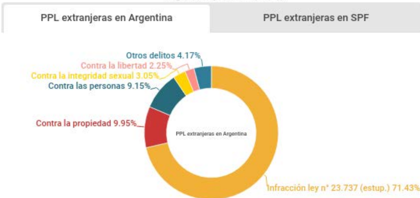
Gráfico: Distribución de delitos imputados a las mujeres extranjeras privadas de su libertad en Argentina y el SPF (2017)